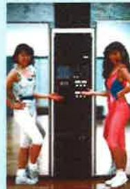
レヴァン調布店オープン当時