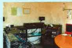
渋谷テープ編集ルーム