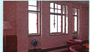
イギリス・ロンドンにて