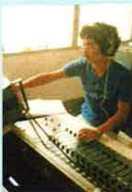
ナイジェリア・ラジオステーションにて