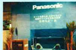
Panasonic・NSE共同開発・水中スピーカ