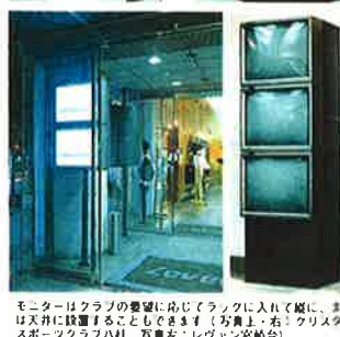
モニターはクラブの要望に応じてラックに入れて壁に、または天井に設置することもできます (写真上、右: クリスタルスポーツクラブ本社 写真左: レヴァン宮崎高)