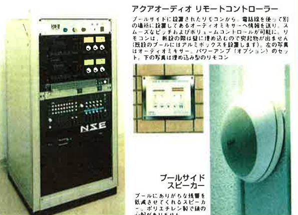
アクアオーディオ リモートコントローラー

エアロビクス専用の超小型オリジナル音響システムラック。この中にレッスンに必要な音響システムをセットできます。インストールラックの身のこなしも軽いため、エールコンミクスに基づいた使いやすい動きも活かせます。また、オートミキサーが搭載されているので移動にも便利。オートミキサー [EVOLUTION3] (ラック上置) のほか、デッキ、イコライザー、アンプなどが組み合わされます。