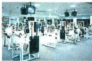
NSEでは音響システムの他に、ジム内に設置するモニターなど、ビジュアル機器のプロデュースも行っています (スポーツクラブルネサンス港南台)