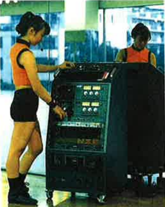
音響システムラック [WK-12CN]

エアロビクス専用の超小型オリジナル音響システムラック。この中にレッスンに必要な音響システムをセットできます。インストールラックの身のこなしも軽いため、エールコンミクスに基づいた使いやすい動きも活かせます。また、オートミキサーが搭載されているので移動にも便利。オートミキサー [EVOLUTION3] (ラック上置) のほか、デッキ、イコライザー、アンプなどが組み合わされます。