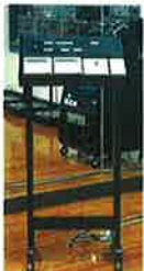
照明コントローラー

特殊照明の制御および空調制御を行うための制御装置。リモコンで手軽に移動できます。