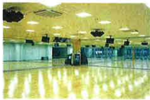
同じくNSEが手掛けたスポーツクラブトリム鶴岡高野台