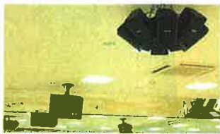
手前が天井から下げるクラスタースピーカー。奥がフロントスピーカー

特殊照明の制御および空調制御を行うための制御装置。リモコンで手軽に移動できます。