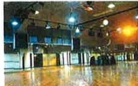
NSEが音響システムを手掛けたスタジオ。そのスタジオにも最適な音響環境に整えられています (アーク観見)

NSE Corporation Tokyo Japan 〒201-0003 東京都 狛江市 和泉本町 1-2-30 TEL 03-5438-2591 FAX 03-5438-2594